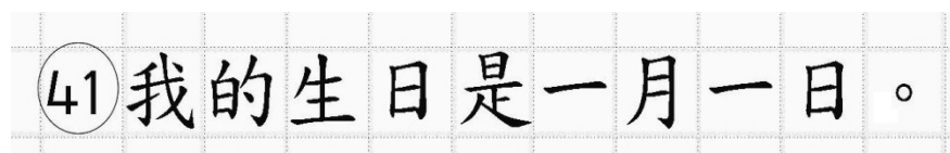
Рис.14. Образец написания иероглифических знаков

Записи в лист 1 и лист 2 бланка ответов № 2 делаются в соответствующей последовательности: сначала в лист 1, затем – в лист 2 и только на лицевой стороне, обратная сторона листов бланка ответов № 2 НЕ ЗАПОЛНЯЕТСЯ!!!