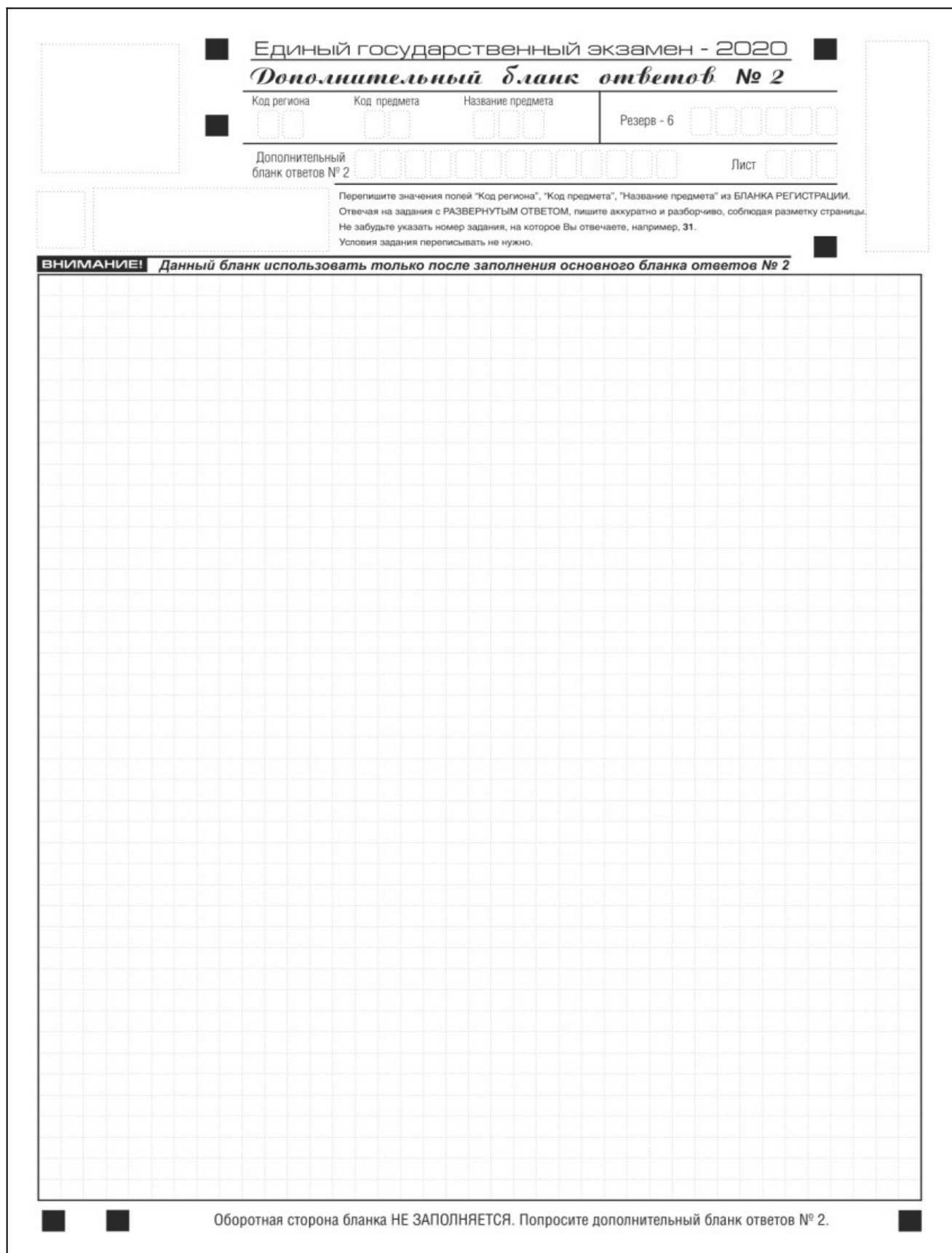
Рис. 15. Дополнительный бланк ответов № 2